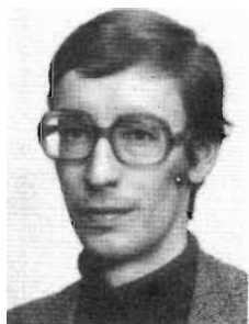
LANDIN HANS SH 3E - 3535