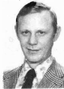
WALTHER STEN SH 3E - 1657