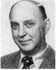
BODIN RUNE SH BV - 2690