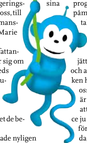
RADIOPANS ILLUSTRATOR: PATRIK LINDVALL

– Public service är i dagens internationella medieklimate inte lika självklart längre.