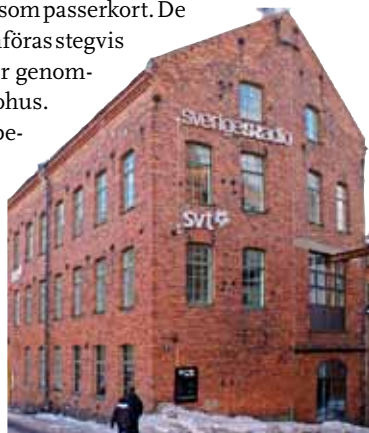
De nya smarta korten gör inpasseringen smidigare. Här radiohuset i Norrköping.

–Längre fram kan korten kanske också lagra personliga datorinställningar för smidig inloggning på funktionsarbetsplatser eller användas för betalning av lunch i personalrestaurangen. Kortet har stor potential, säger Wolfgang Matl.