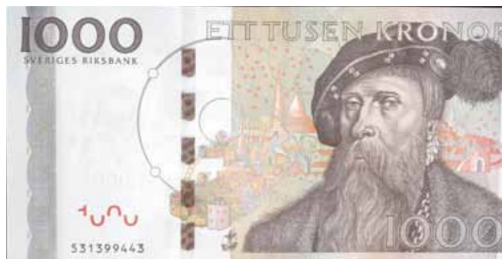
En tusenlapp för bästa nyhetstipset i Örebro eller 2000 kronor i Uppland. Det ger idéer som man bygger vidare på i sändningarna.