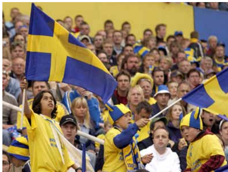
2012 är ett viktigt sportår med OS, Paralympics och Fotbolls-EM.

När det gäller mer konkreta handlingar och programförändringar nästa år ska Kulturnytt och Mitt i musiken hitta sätt att samarbeta för att